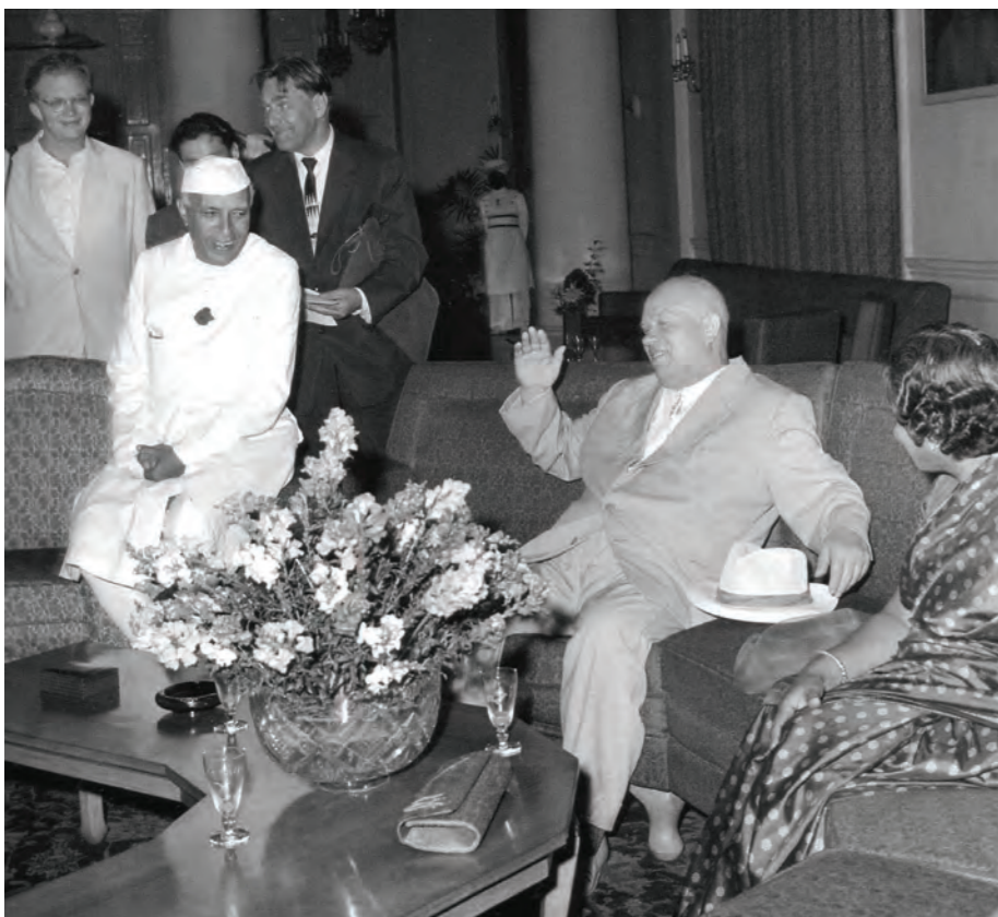
Фундамент российско-индийского сотрудничества закладывали первый премьер-министр Индии Джавахарлал Неру и советский лидер Никита Хрущев

тивоедействиях и циничном отношении со стороны колониальных властей по поводу и без повода. Начиналась весьма своеобразная политическая дуэль «Лорд Керзон-консул фон Клемм», которую всемогущий британский вельможа в конечном итоге все-таки проиграл.