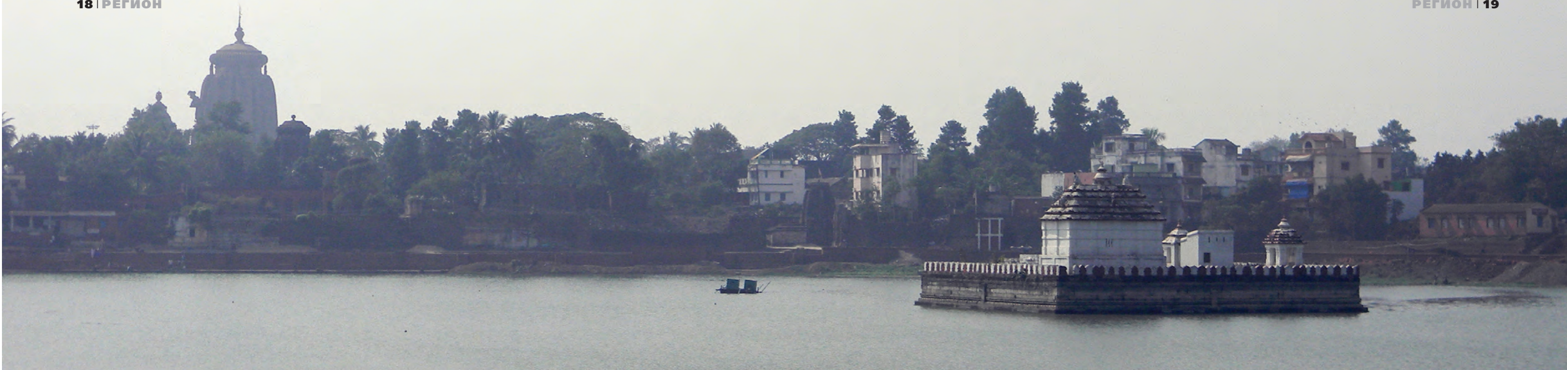
Озера возле храмов тоже считаются священными

каст, так называемых далита. Вход на территорию не индустам запрещен, что же касается далита, то тут все не так однозначно.