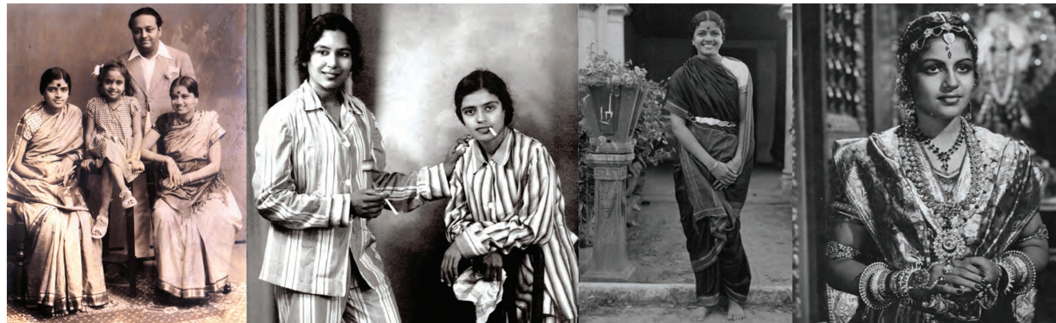
М.С.Суббулакшми в кругу близких