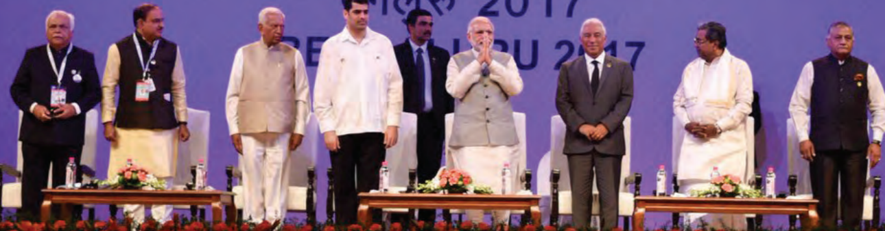
В этом году День Индийской Диаспоры собрал в Бангалоре множество знаменитостей, включая премьер-министра Индии Нарендру Моди