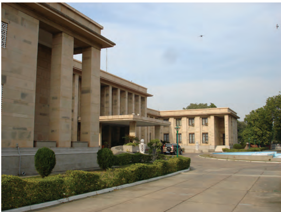
Российское посольство в Дели

Отмечаемое в этом году 70-летие установления дипломатических отношений между Россией и Индией заставляет нас обратиться к истории двусторонних связей