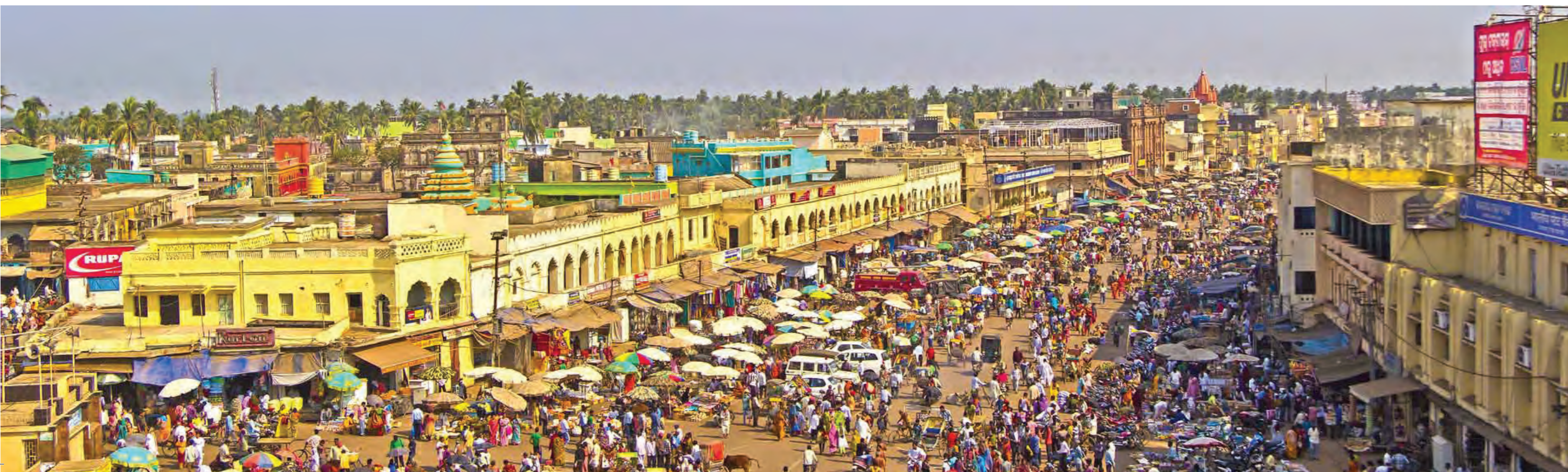
К храму Джаяннатх в Пури ведет непривычно широкая для Индии улица, но в праздники и она не вмещает всех паломников

Перед входом в Джаяннатх нарисован мелом белый прямоугольник – это место для представителей низших