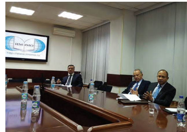
Панкадж Саран на Примаковских чтениях в Институте мировой экономики и международных отношений