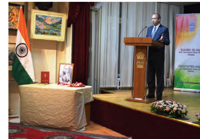
Панкадж Саран на встрече с российской общественностью по случаю Дня Конституции Индии