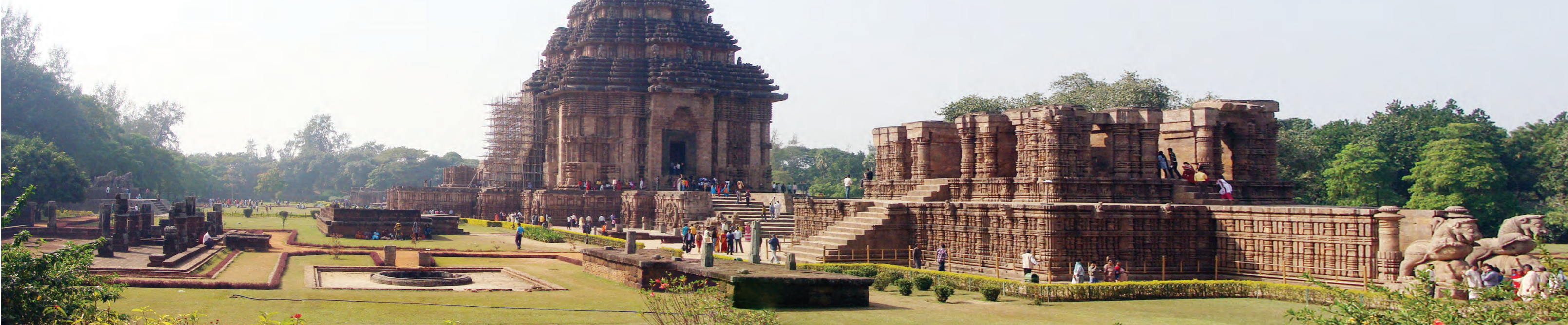
Храм Солнца в Коранаке внесен в список Всемирного наследия ЮНЕСКО