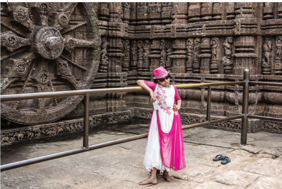
В Индии яркий наряд - не показатель достатка, а норма жизни

Наша справка: Калинга – древнее государство, располагавшееся на территории современной Ориссы. Оно было известно своими купцами и пиратами, освоившими Бенгальский залив и ходившими также в Юго-Восточную Азию, вплоть до острова Ява, а, возможно, и дальше. Калинга существовала примерно с 7 века до н.э. Но в 260 г. до н.э. ее завоевал знаменитый царь Ашока, присоединив к землям династии Маурьев. Как писали очевидцы, в битве за Калингу погибло около 100 тысяч человек, по тем временам невообразимое количество, а река Дайя, на которой проходила битва, стала от крови совершенно красной.