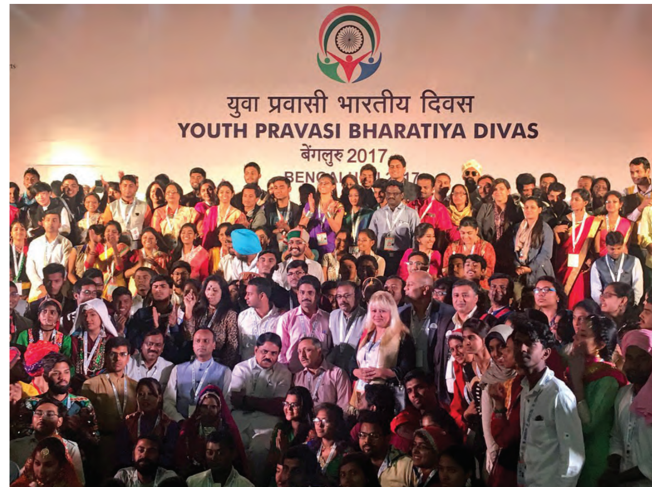
Среди гостей Дня Индийской Диаспоры в этом году было немало молодежи

О том, какое значение придает ему высшее руководство Индии свидетельствует тот факт, что в этом году в мероприятии в Бангалоре приняли участие премьер-министр Индии Нарендра Моди, президент Пранаб Мукерджи, а также высокопоставленные иностранные гости – премьер-министр Португа-