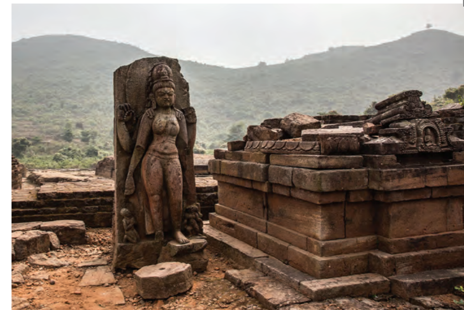
После 9 века н.э. буддизм практически исчез из Индии, а буддистские храмы оказались заброшены. Теперь археологи их восстанавливают

Хотя буддизм в Индии непопулярен несмотря на все старания царя Ашоки, у ступы масса паломников, несущих вверх по лестнице гирлянды ярко-оранжевых ноготков к статуям Будды. Тут же находится рынок – на нем можно купить самые вкусные в Индии (по крайней мере, так утверждают местные жители) орехи кешью – один