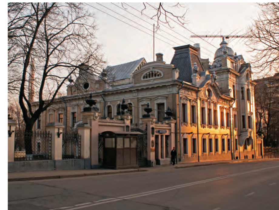
Индийское посольство в Москве