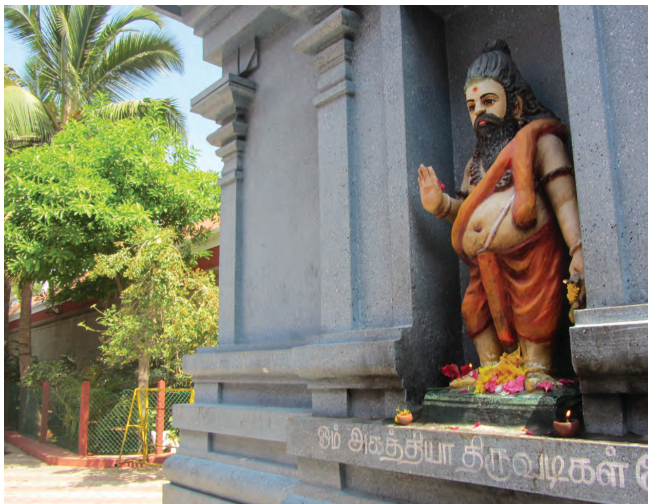
Об сиддхах известно немного, однако без них представление об индуизме и индийской культуре было бы неполным

В обыденных разговорах об Индии, которые ведут в России и далеко за пределами, все еще нередко возникают несметные сокровища, уникальные архитектурные сооружения, заклинатели змей и, конечно, йоги, лежащие на гвоздях или завязывающие тело узлом. Впрочем, многие любители Индии сейчас имеют возможность посмотреть на нее своими глазами, и рассказами о йогах и священных коровах их уже не удивишь. К тому же есть и более серьезные люди – искатели истины и духовных богатств, жаждущие приобщиться к многовековой мудрости индийцев, искать в ней ответ на вопросы о предназначении человека, о его природе, о его возможностях.