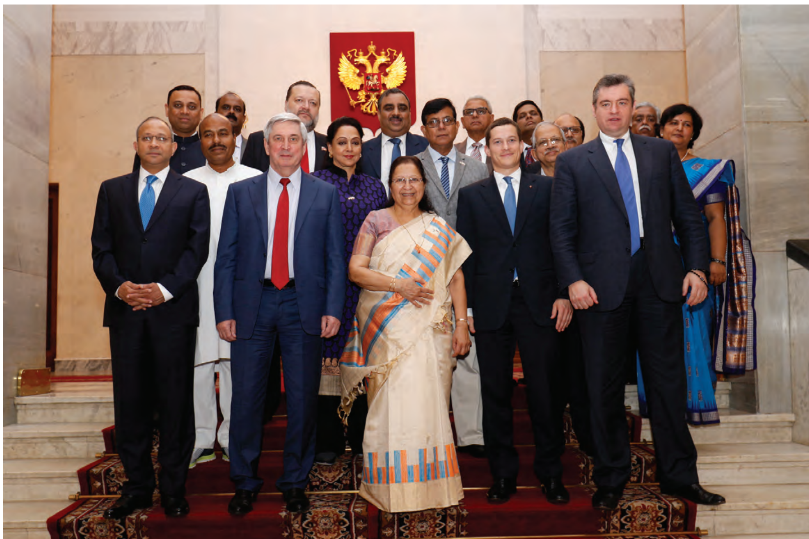
Российские депутаты тепло принимали спикера нижней палаты индийского парламента Сумитру Махаджан

дательства, в том числе в этой сфере», – обозначил приоритетные направления сотрудничества председатель Госдумы РФ. Кроме того, по его мнению, к этим вопросам правильно было бы отнести темы развития цифровой экономики. «Исходя из того, что Индия и Россия многое делают в этом направлении, возможно, вы поддержите формат обсуждения конкретных тем с участием наших профильных комитетов и поиска совместных решений в рамках законотворчества, которые бы позволили нам развивать отношения более эффективно», – добавил Вячеслав Володин.