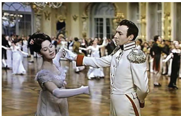
«Война и мир» 1967 год

Ну, а российское кино в Индии? Оно демонстрируется в Российских центрах науки и культуры в Нью-Дели, Мумбаи, Ченнаи, Тривандруме. Там регулярно проводятся кинофестивали российского кино. Российские фильмы, актеры участвуют в Международных кинофестивалях в Нью-Дели, Мумбаи, Гоа. В 2015 году на 46-м Индийском международном кинофестивале в Гоа была показана ретроспектива фильмов мэтра российского кино Никиты Михалкова. Он был награжден призом за вклад в мировой кинематограф.