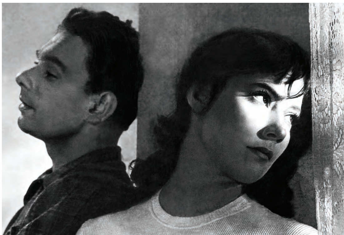
«Летят журавли» 1957 год

В 2016 году в Мумбаи с большим успехом прошел второй международный кинофорум «Дни российского кино». Он представил 8 новых фильмов. И среди них фильм «Ледокол», основанный на реальных событиях, произошедших с ледоколом «Михаил Сомов» в 1985 году. Корабль был зажат антарктическими льдами и поврежден. Его экипаж провел 133 дня среди льдов. Показ фильма прошел с аншлагом.