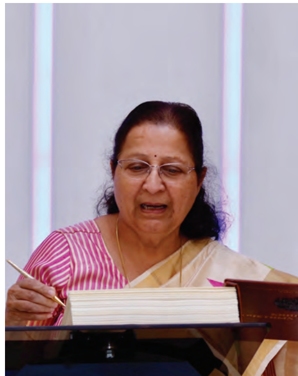
Находясь в Москве, спикер нижней палаты Сумитра Махаджан быстро нашла общий язык с председателем Госдумы Вячеславом Володиным и спикером Совета Федерации Валентиной Матвиенко

нут только более крепкими, более дружественными, более глубокими», – заявила Сумитра Махаджан.