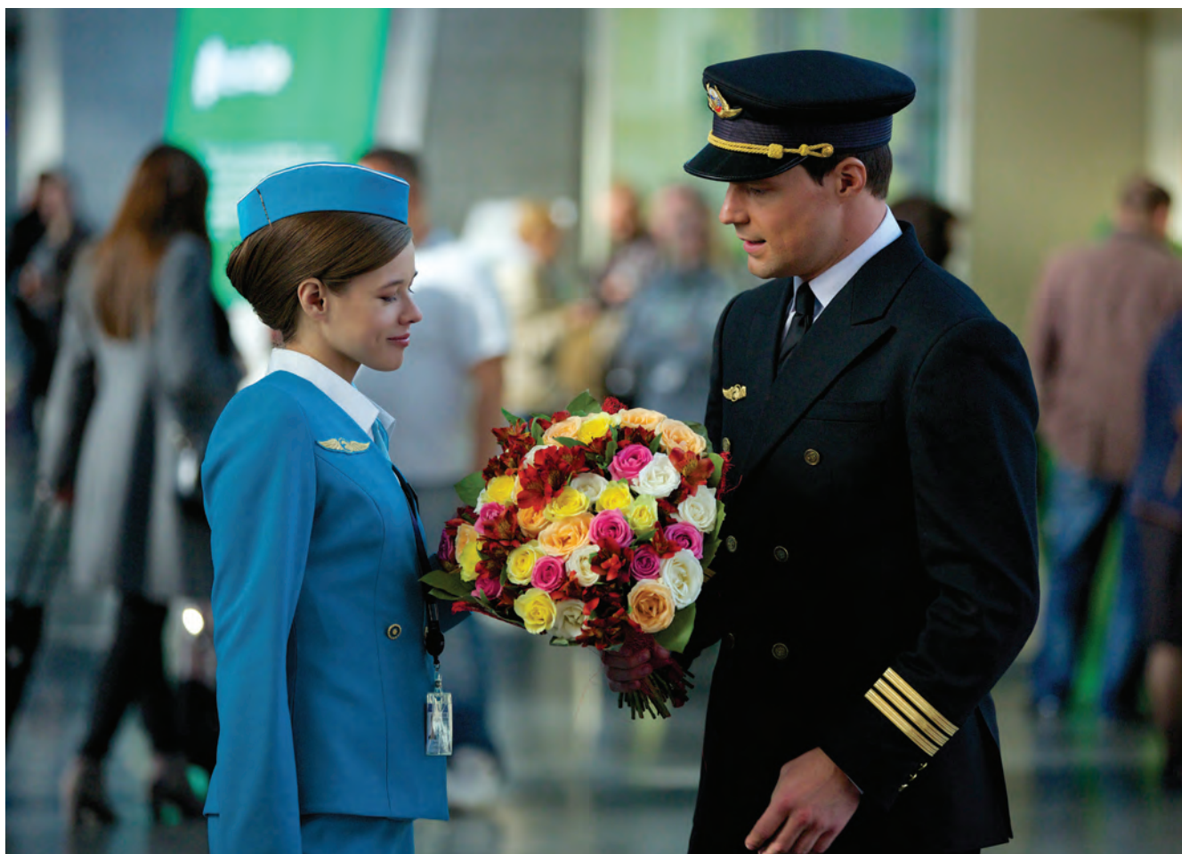
Российский фильм «Экипаж» с участием популярных актеров Владимира Машкова и Даниила Козловского имеет все шансы понравиться самым взыскательным индийским зрителям

В этом году – впервые за 25 последних лет, в индийский прокат выходит российский фильм. Это «Экипаж» режиссера Николы Лебедева – один из наиболее кассовых отечественных фильмов предыдущего года. Он сделан в формате IMAX. Эмоционально насыщенный, с незабываемыми визуальными эффектами. И российскими супер-звездами Даниилом Козловским и Владимиром Машковым. Индийская компания RG Studios выпускает его на более чем 250 экранах. На английском, хинди, тамили и телугу.