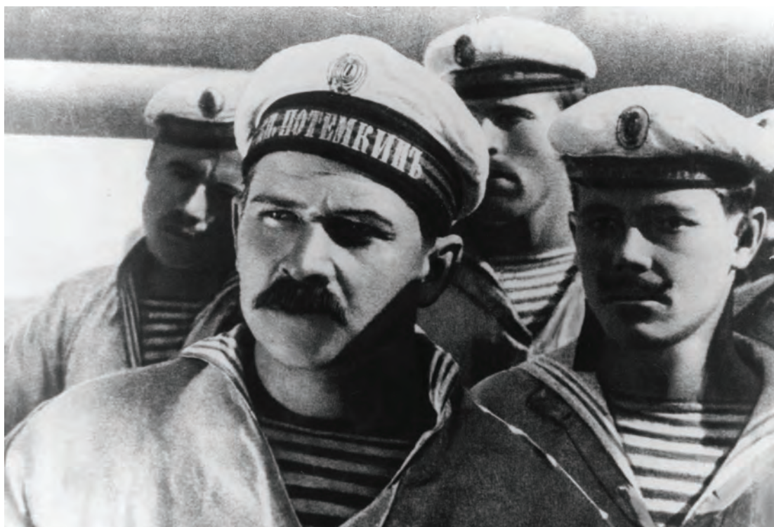
«Броненосец Потемкин» 1925 год

в тот период в Индии ежегодно выходили в прокат 25 советских фильмов. И для их демонстрации государство в лице «Совэкспортфильма» арендовало более 100 кинотеатров.