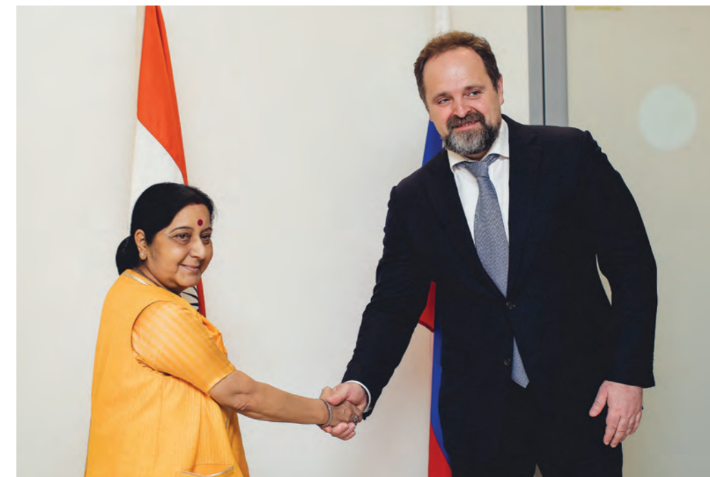
Программа пребывания главы МИД Индии Сушмы Сварадж во Владивостоке была насыщенной и разнообразной

Вторая тема ВЭФ – «Мы соседи: зарабатываем, сотрудничая» – была посвящена интеграции России в экономику стран Азиатско-Тихоокеанского региона (АТР).