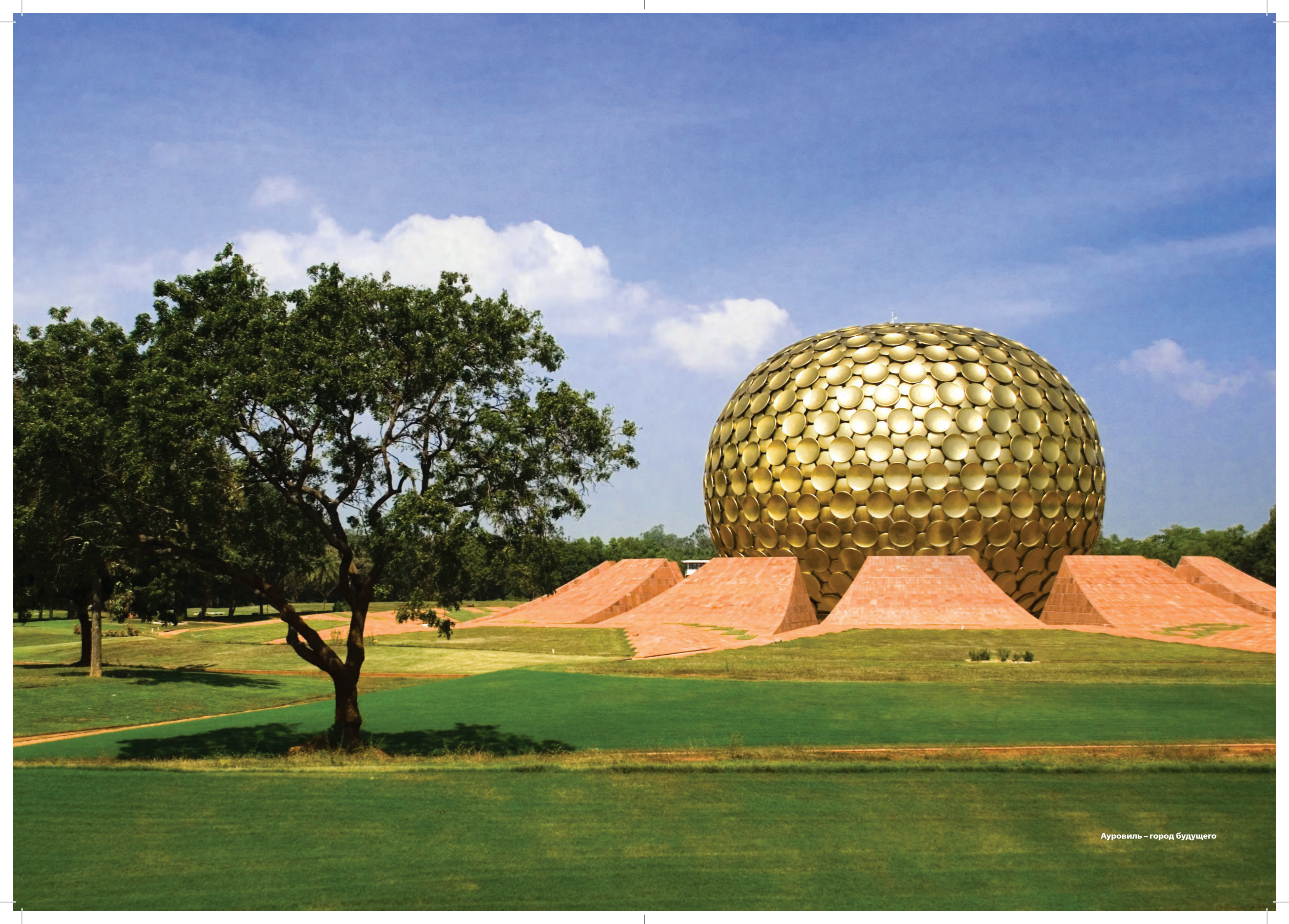
Ауровиль – город будущего