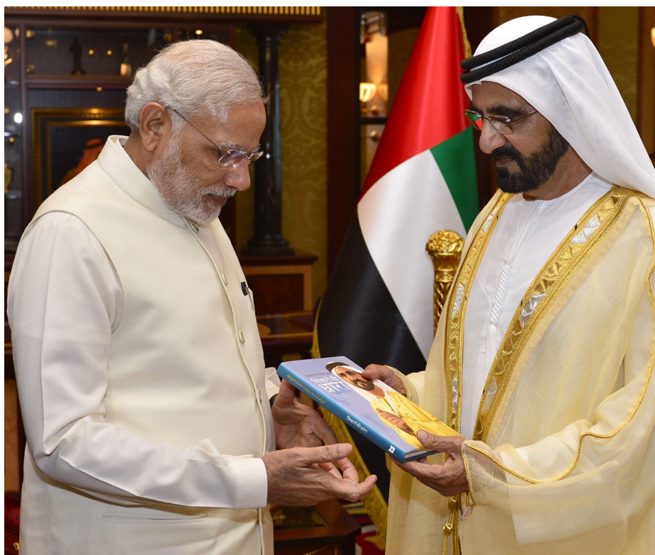
Премьер-министр Нарендра Моди получает книгу от вице-президента и премьер-министра ОАЭ Мохаммеда бин Рашида аль-Мактума на встрече во Дворце Заабил в Дубае

10. Близость, история, родство культур, тесные связи между людьми, естественные синергии, совместные стремления и общие проблемы создают безграничный потенциал естественного стратегического партнерства между Индией и ОАЭ. Тем не менее в прошлом отношения между двумя правительствами не поспевали за экспоненциальным ростом в отношениях между людьми или перспективами такого партнер-