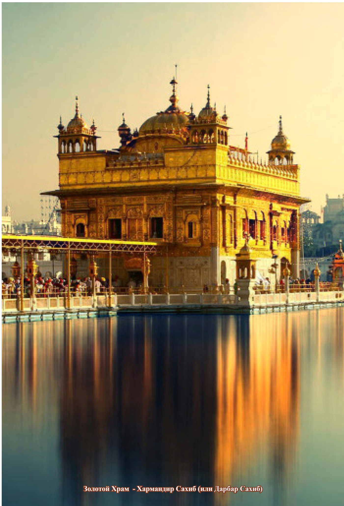
Золотой Храм - Хармандир Сахиб (или Дарбар Сахиб)