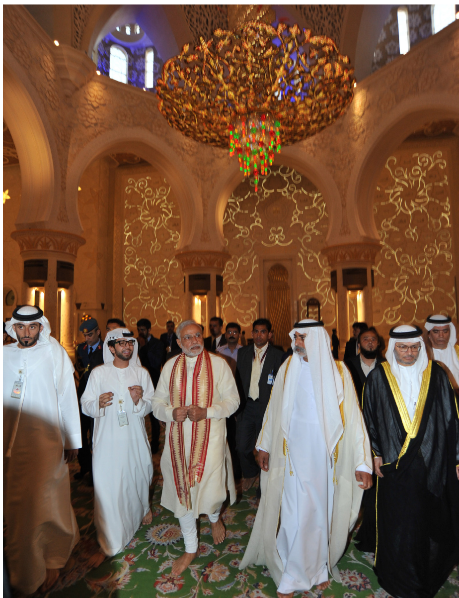
Премьер-министр Нарендра Моди в первый день своего визита посетил главную мечеть Шейха Зайеда в Абу-Даби

XVIII. Признавая тот факт, что Индия становится новой об-