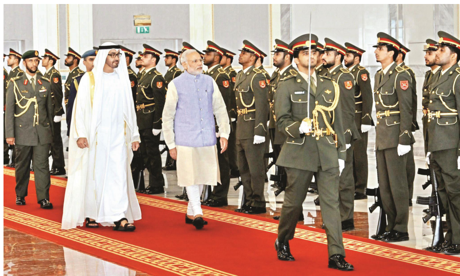
Премьер-министр Нарендра Моди и Его Высочество наследный принц Мохамед Бин Зайед Аль Нахайян, принимающий почетный караул во время приема в Президентском Аэропорту в Абу-Даби

X. Сотрудничать в целях укрепления безопасности на море в Персидском заливе и регионе Индийского океана, который имеет жизненно важное значение для безопасности и про-