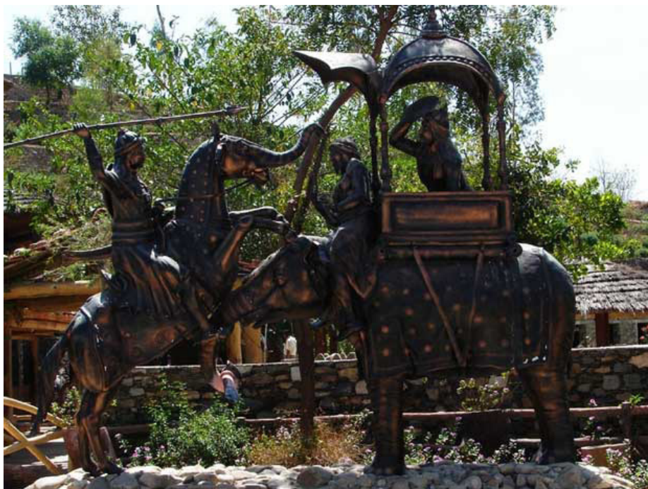
Музей Махарана Пратапа

Теперь дворец содержит много антикварных изделий, картин, декоративные убранства и утвари, которые привлекают тысячи посетителей каждый день.