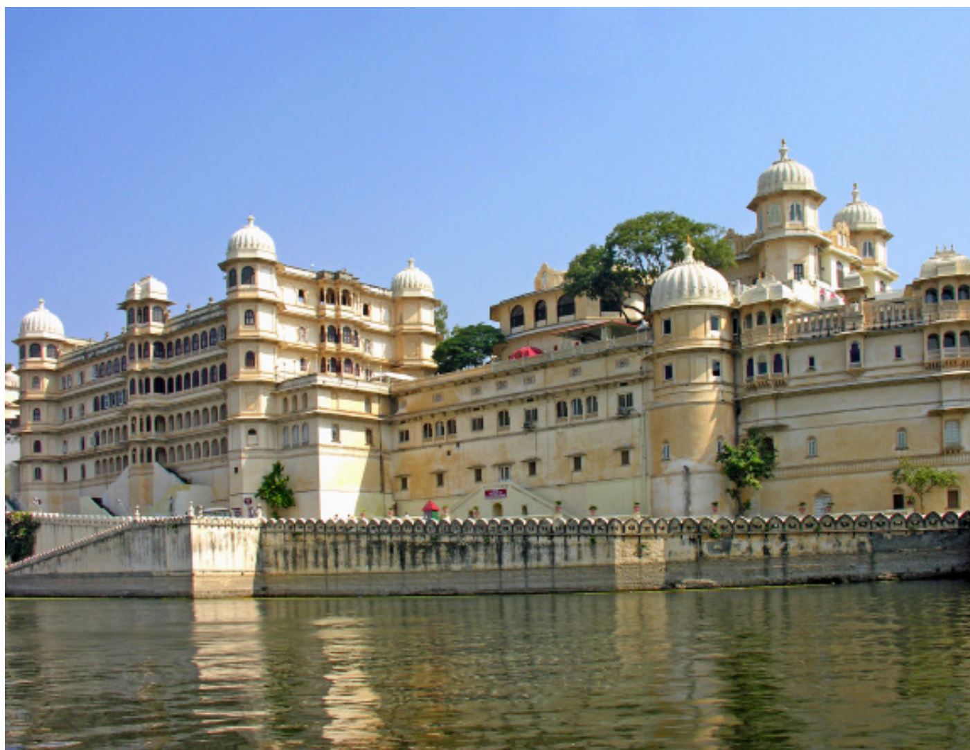
Городской Дворец, Удайпур

Ворота Триполия - это главный вход с тройной аркой в Удайпуре, построенный в 1725г. Путь через нее приводит к сериям внутренних дворов, террас, коридоров и садов - трудно описать гармоническое богатство. Здесь Сурадж Гокхда, где Махарана Мевара представил себя в трудные времена для людей, чтобы восстановить доверие. Мор-Чоук (Павлиний внутренний двор), получила свое название от ярких мозаик в стекле, украшающих его стены. Чини Читршала примечателен, в то время как ряд настенной живописи Кришны представлены на