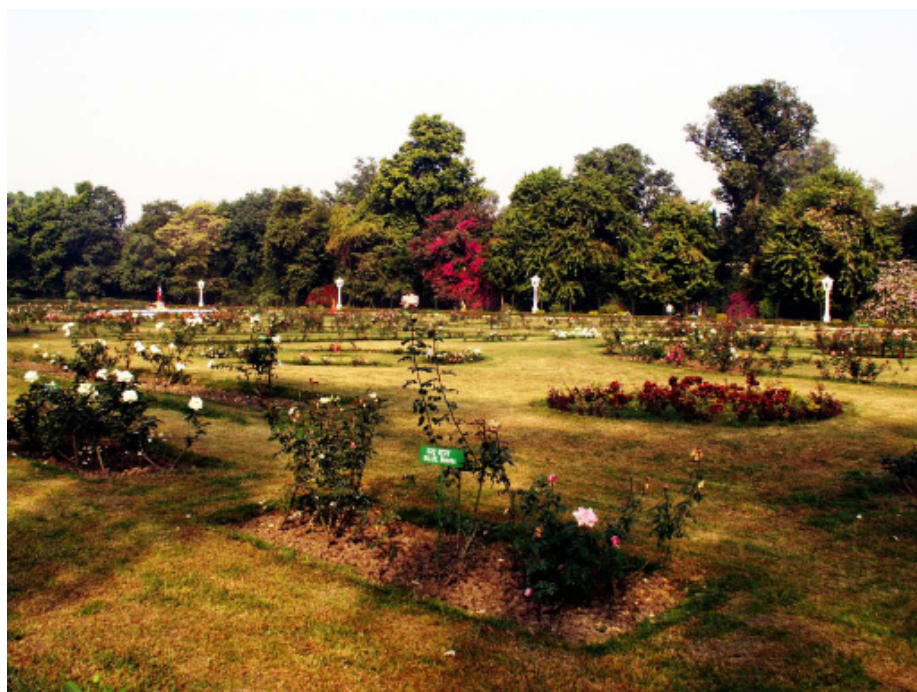
Розарий и Зоопарк