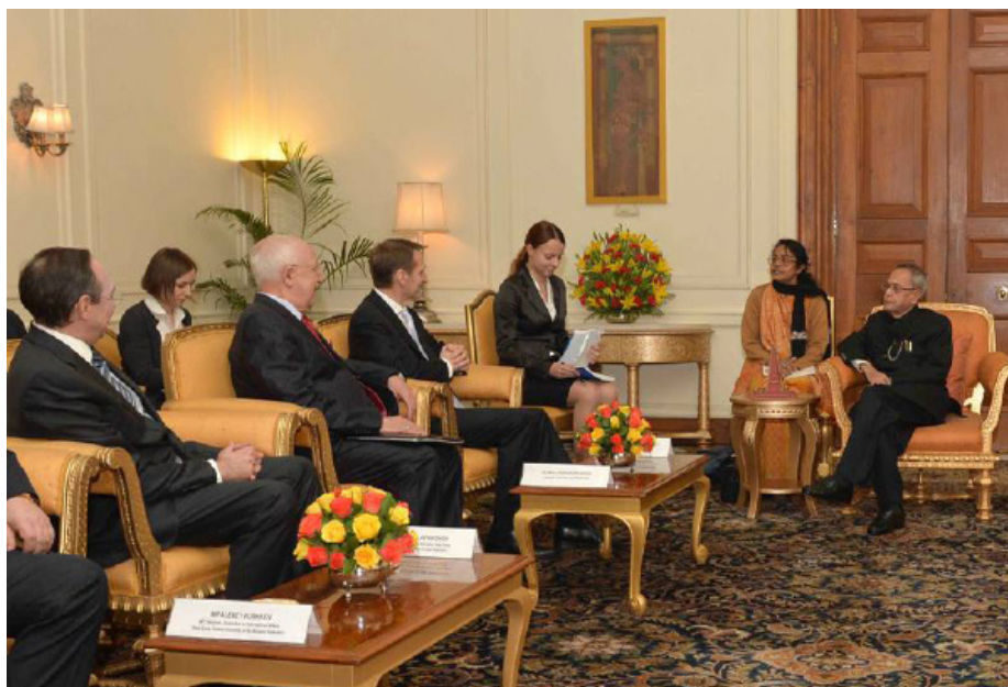
Встреча с Президентом Индии

"На протяжении многих лет специальная и привиле-