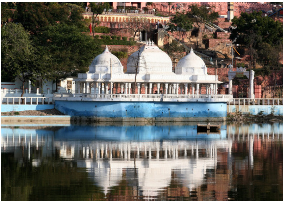
Дух Талай (Сад камней)

Музей народных искусств содержит интересную коллекцию индийского фольклорного искусства, включая одежду, украшения, кукол, маски, народные музыкальные инструменты, статуэтки божеств и живопись.