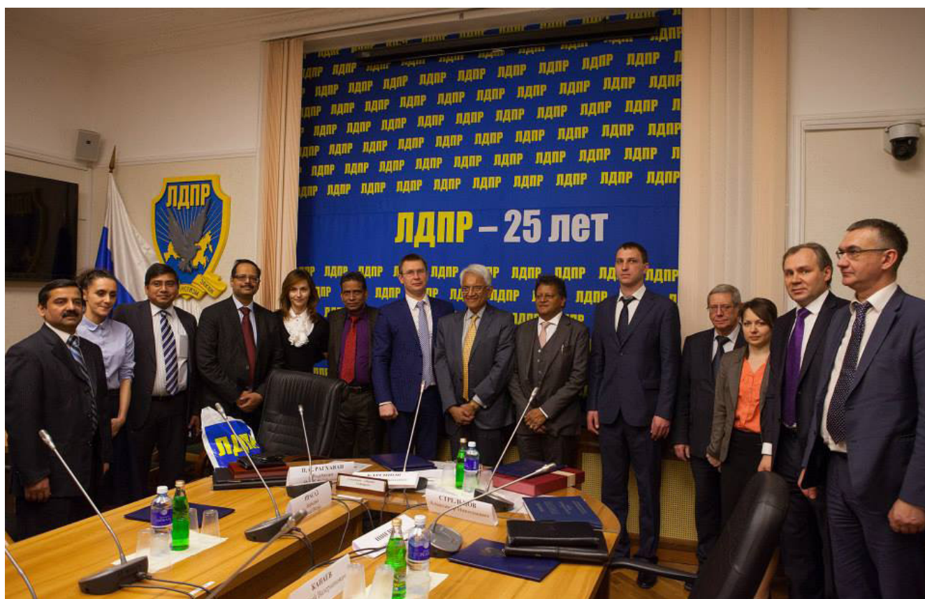
После церемонии подписания соглашения

В Государственной Думе РФ в офисе ЛДПР (Либерально-демократической партии России) 19 февраля 2015 года был подписан Договор о партнерстве между неправительственной автономной некоммерческой организацией Институт Мировых Цивилизаций (ИМЦ) и некоммерческой организацией Русско-Индийское Общество Дружбы "Диша" (DISHA). Кроме того, был подписан трехсторонний Меморандум о взаимопонимании по академическому, научному и культурному сотрудничеству между