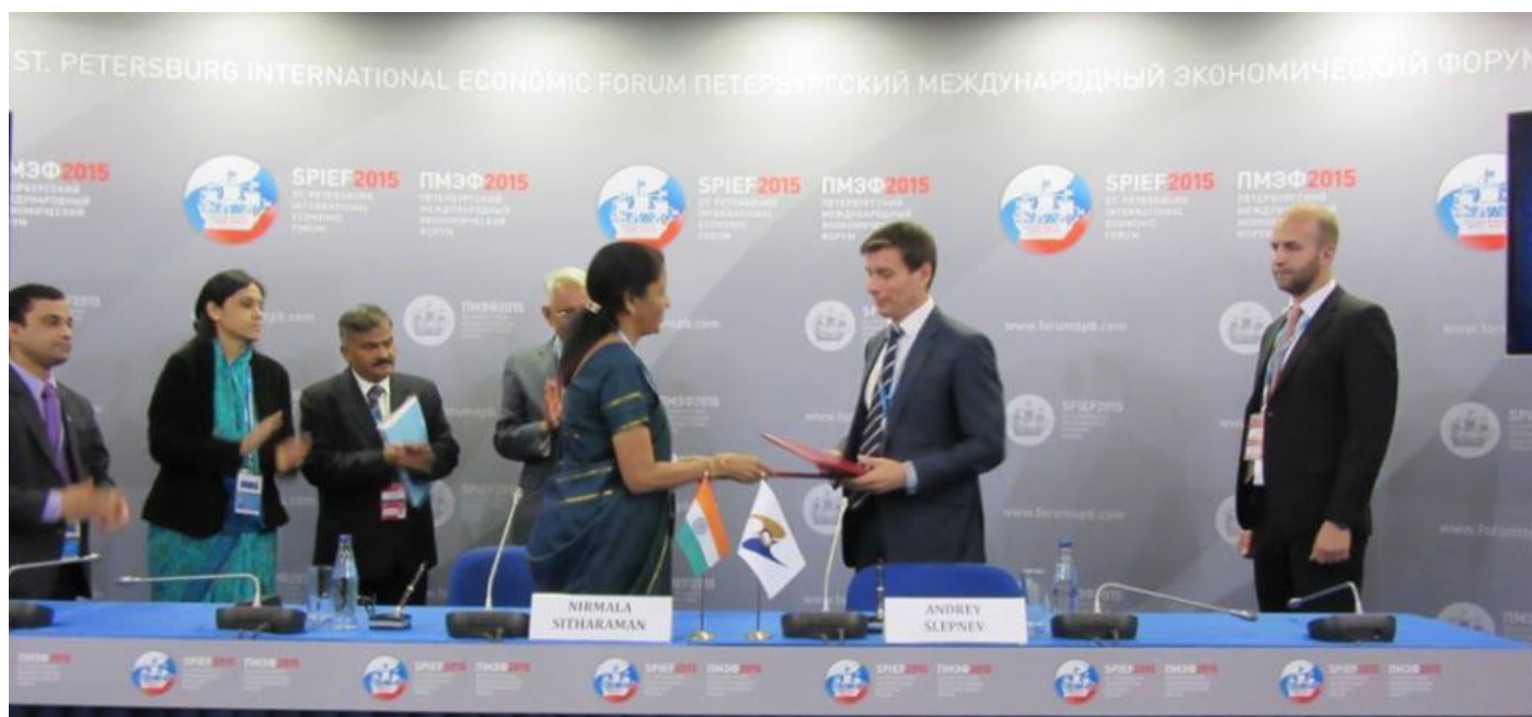
Петербургский международный экономический форум (ПМЭФ)

ровала российскую сторону о рационализации и либерализации политики в области ПИИ и рассказала о шагах, предпринятых для "Свободного видения бизнеса" в Индии в рамках флагманской программы "Сделай в Индии" и недавних инициативах, которые предоставляют большие возможности для российских инвесторов в Индии.