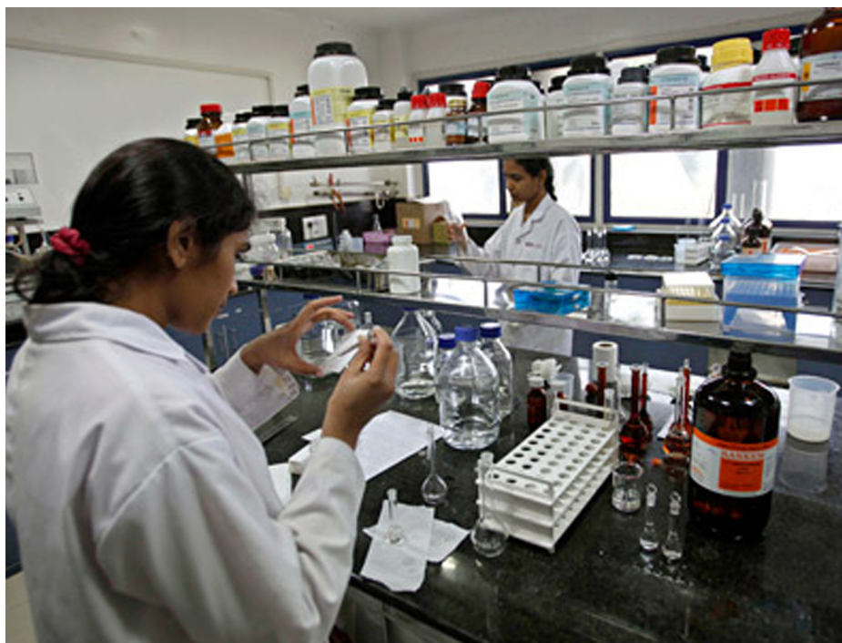
Индия поставляет антибиотики, вакцины от гепатита, лекарства от кишечных инфекций и противогрибковые препараты на российский рынок

Александра Катц (Russia & India Report) 17 июнь 2015