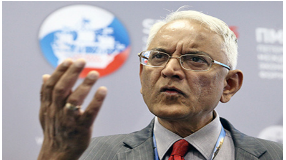
Пунди Сринивасан Рагхаван в преддверии саммитов БРИКС и ШОС в Уфе рассказал об отношении Дели к этим двум организациям

- В последние годы БРИКС стал важным многосторонним форумом для проведения консультаций, координирования действий и сотрудничества по вопросам современной глобальной повестки дня, представляющим взаимный интерес. В последние годы повестка дня встреч в формате БРИКС значительно расширилась и затрагивает такие вопросы как международный терроризм, изменение климата, продовольственная и энергетическая безопасность, глобальные экономические тренды, устойчивое развитие и дискуссии в рамках ВТО. Позиции стран-членов БРИКС совпадают по вопросам построения демократического и многополярного мироустройства. БРИКС состоит из пяти крупных экономик, на территории которых проживает порядка 40% мировых человеческих ресурсов, и которые производят около 25% мирового ВВП. Вместе эта пятерка имеет сильное экономическое влияние на между-