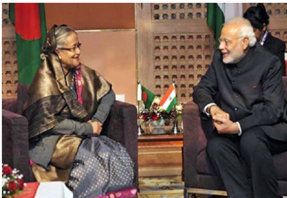
Премьер-министр Нарендра Моди и Премьер-министр Бангладеш Шейх Хасина

Сегодня мы запустили две службы автобусных услуг, которые будут способствовать