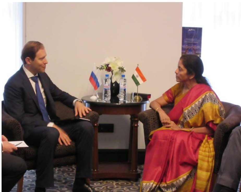
Г-жа Нирмала Ситхараман с г-ном Денисом Мантуровым во время двухсторонней встречи

Г-жа Нирмала Ситхараман возглавила представительную делегацию на ежегодном Петербургском международном и экономическом форуме (ПМЭФ), состоявшемся 18-20 июня 2015 г. в которую вошли предприниматели из Конфедерации индийской промышленности (СИП) в составе 30 человек. Министр провела двусторонние переговоры с г-ном Виктором Христенко, председателем правления Евразийского экономического Союза, г-ном Денисом Мантуровым, министром промышленности и торговли, г-ном