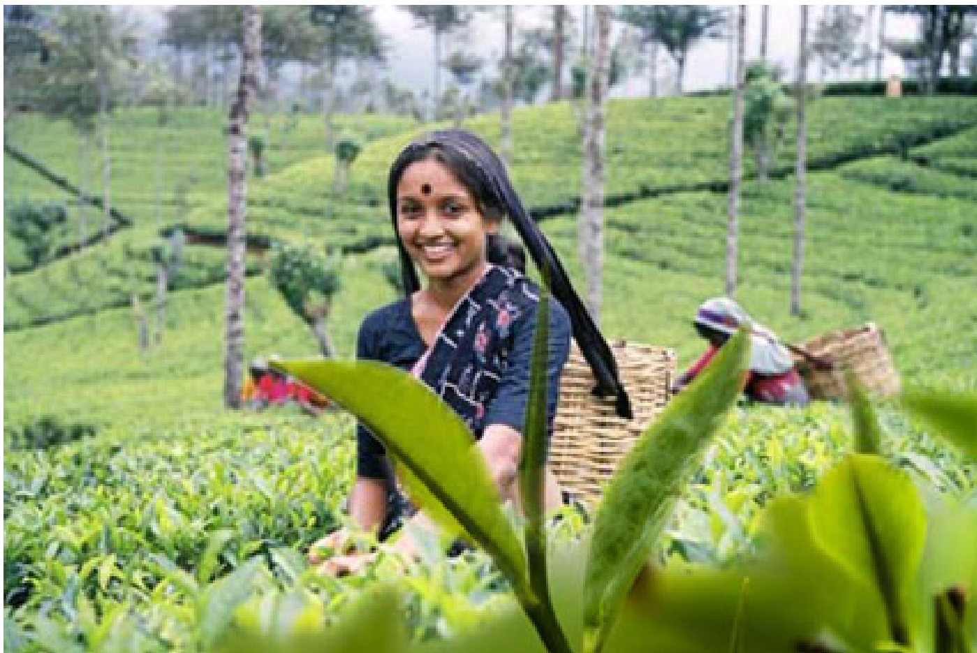
Чайные плантации Муннара