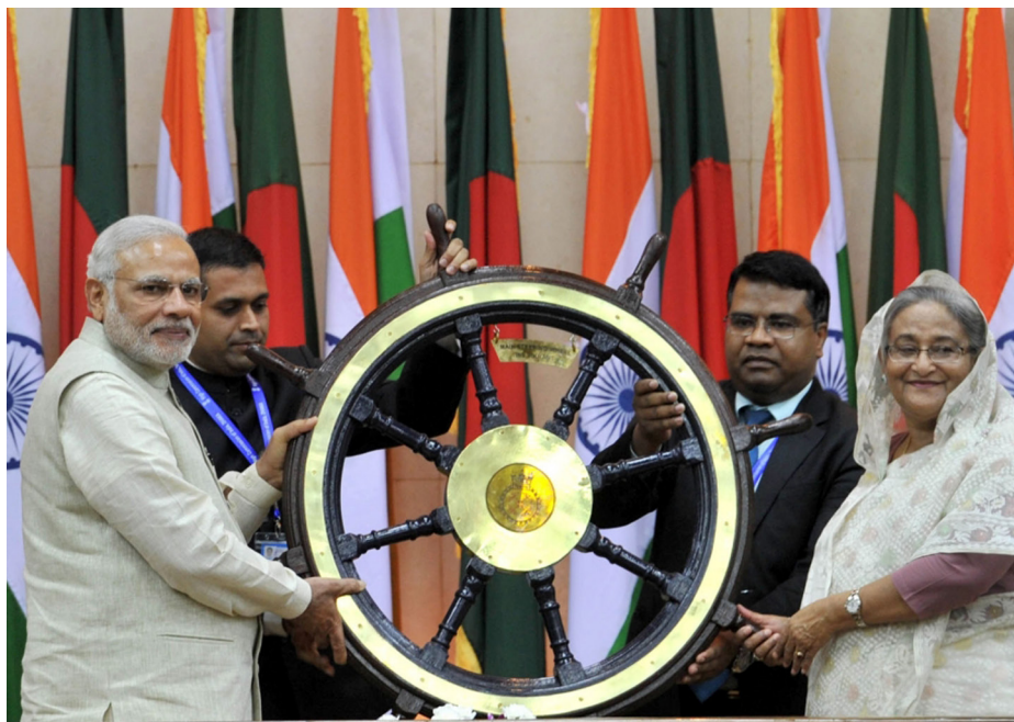
Премьер-министр Нарендра Моди передает Премьер-министру Бангладеш Шейх Хасине рулевое колесо Лёгкого авианосца Vikrant

Мы согласились урегулировать линии морской границы в прошлом году. Это свидетельствует о зрелости наших отношений и нашей общей приверженности между-