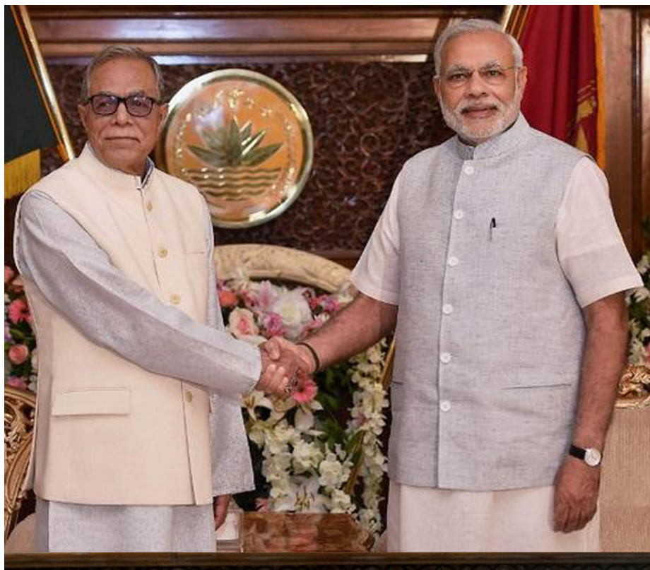
Премьер-министр Нарендра Моди пожимает руку Президента Бангладеш Мохаммеда Абдул Хамида

Наше сотрудничество в сфере безопасности растет, о чем свидетельствует соглашения о мерах по борьбе с торговлей людьми, подделкой