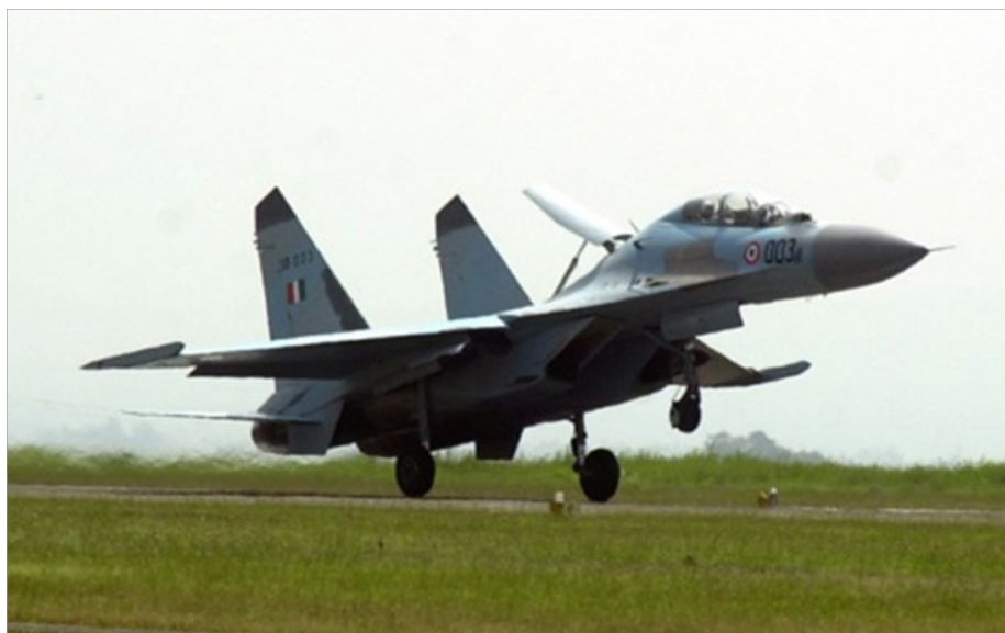
Общий объем заказов ВВС Индии на Су-30МКИ составляет 272

ВВС Индии гордятся иметь на вооружении истребитель Су-30МКИ, один из самых мощных истребителей в мире, заявил Раджив Пратап Руди, государственный министр по делам предпринимательства и повышения квалификаций Индии, опытный пилот. К 2018г. ВВС Индии, как ожидается, будут иметь в своем арсенале 14 истребителей Су-30МКИ.