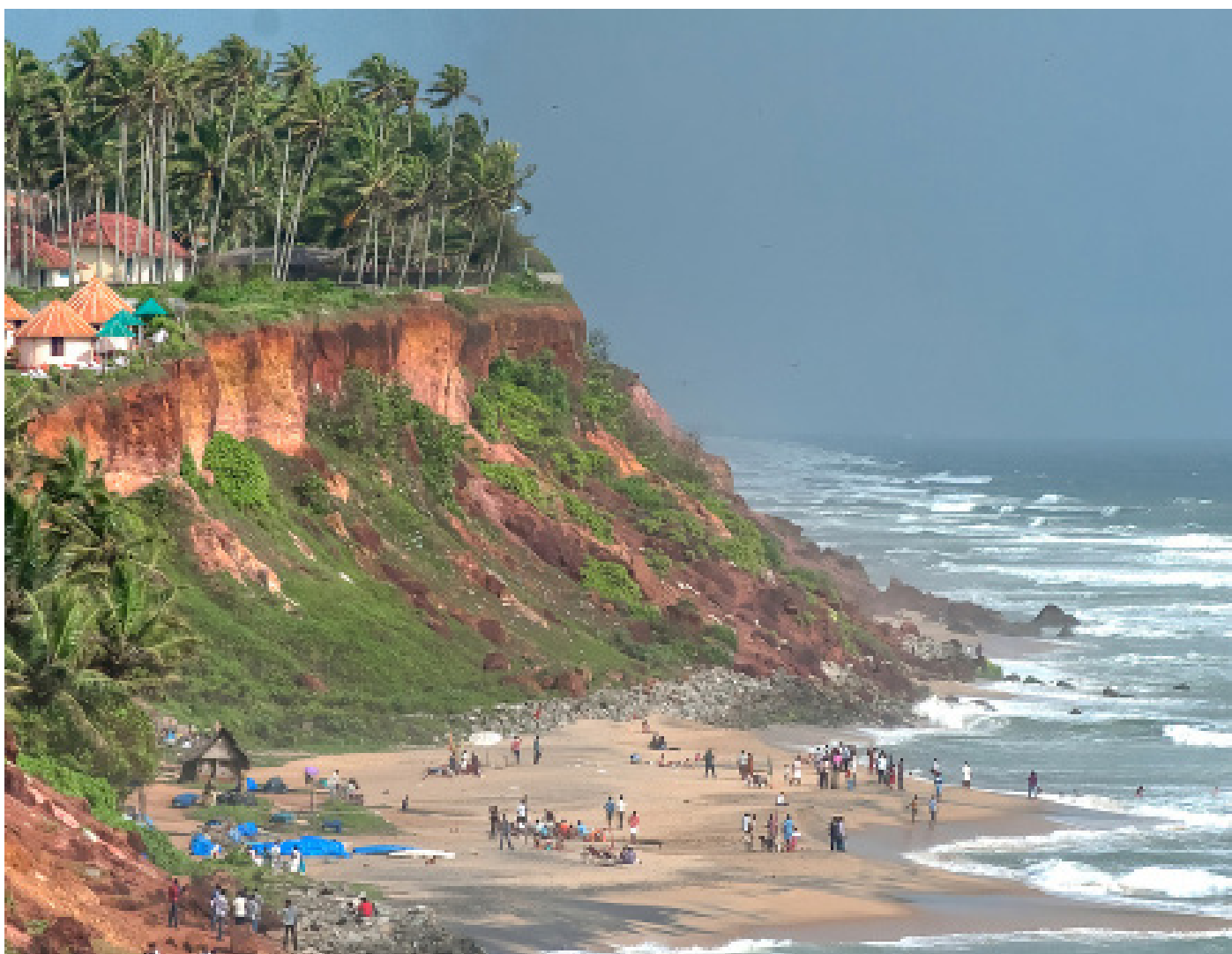
Береговой уступ Варкалы