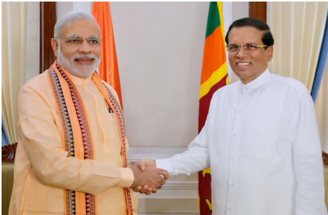
Премьер-министр Нарендра Моди и Президент Шри Ланки Майтхрипал Сирисена

Премьер-министр Нарендра Моди посетил Сейшельские острова в рамках своей пятидневной поездки по трем ключевым странам Индийского океана, включая Маврикию и Шри-Ланку. При этом он заявил, что прочные отношения с данными государствами являются залогом безопасности и развития Индии.