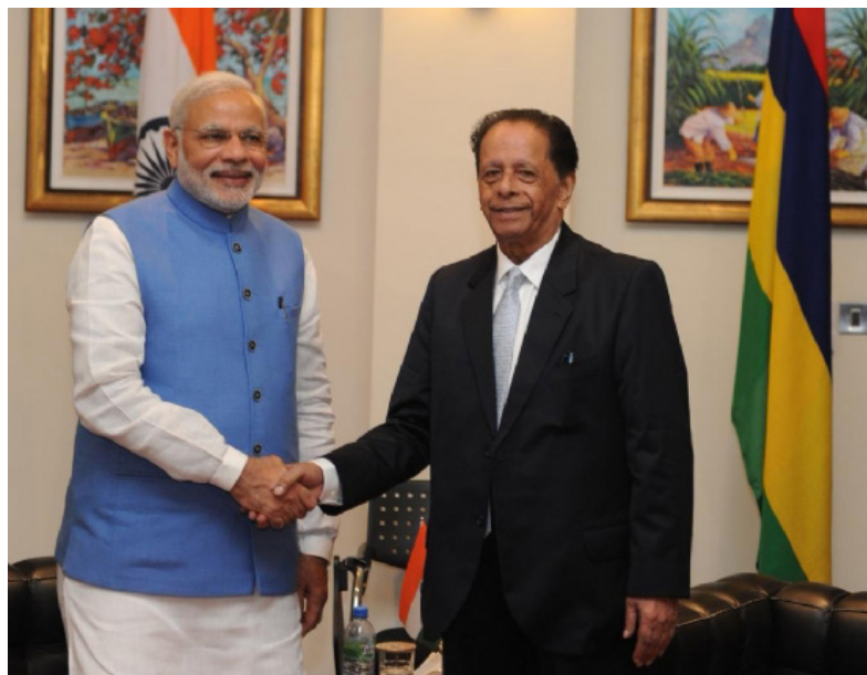
Визит Премьер-министра Нарендра Моди в Маврикий

Премьер-министр отметил, что с нетерпением ждет переговоров с Премьер-министром Анерудом Джагнатом по дальнейшему углублению двустороннего стра-