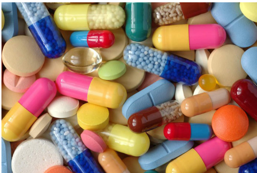
Новые лекарственные средства от малярии, остеопороза и диабета в настоящее время проходят клинические исследования

"Я уверен, что деятельность лабораторий по производству лекарственных препаратов под управлением СНПИ согласуется с Миссией "Чистая Индия". Наши ученые сосредоточили свое внимание на инфекционных заболеваниях и на так называемых "болезнях ци-