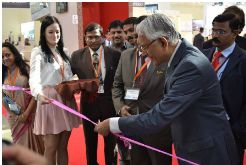
Церемония открытия стенда

Во время выставки Индийский Совет по чаю предложил посетителям и участникам бесплатно попробовать индийский чай. Студенты из Культурного центра им. Джавахарлала Неру представили культурную программу.