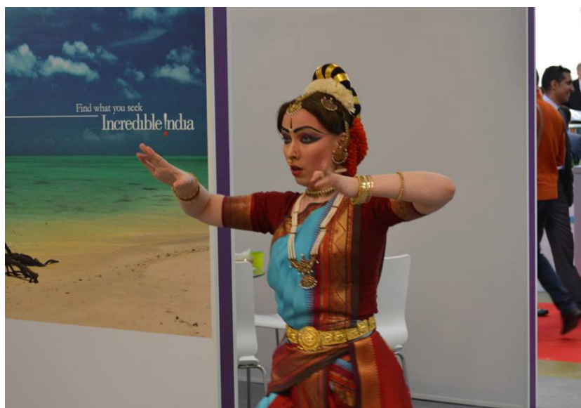
Культурная программа студентов Культурного Центра