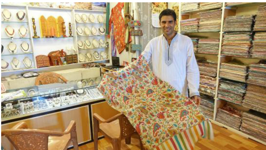
Торговый центр: кашемировая шаль