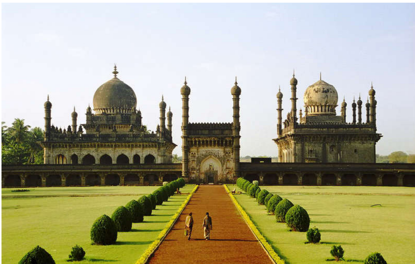
Ибрагим Рауза - Исламская архитектура

разное время, и поэтому можно сказать, что город имеет огромную историческую ценность для Индии.