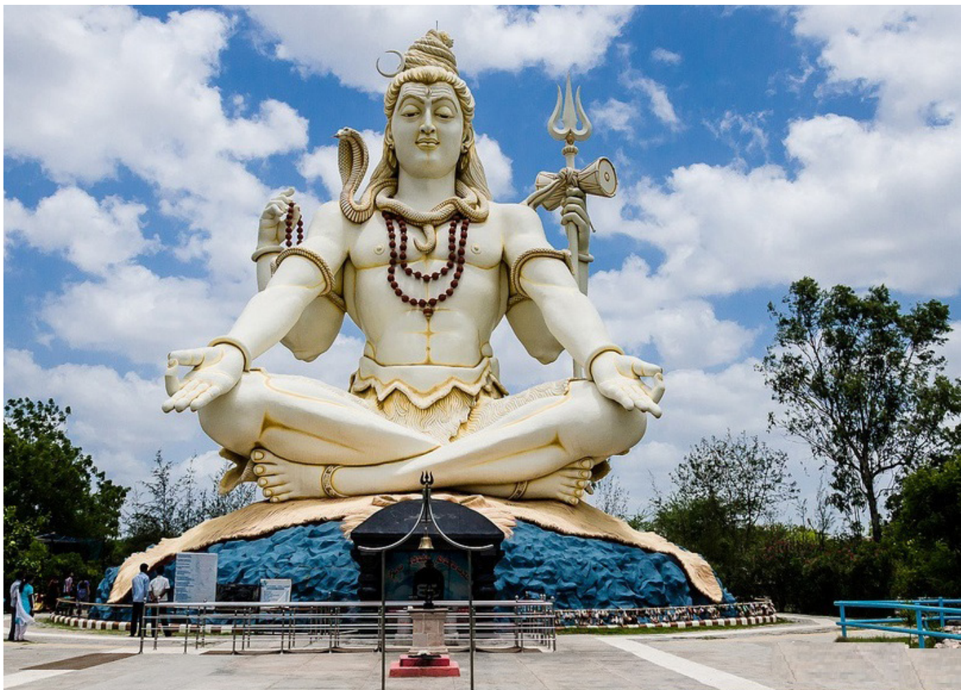
Гигантская статуя господ Шивы Гири, Биджапур