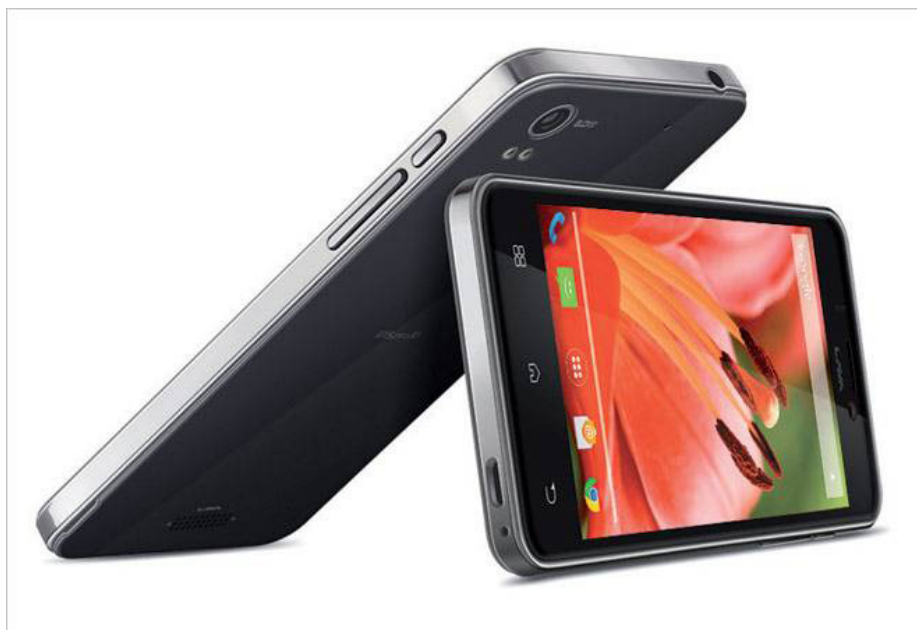
В настоящее время над этими вопросами в компании работают около 250 человек в Нью-Дели и около 550 – в Китае.

"Мы перенесем всю технологическую экосистему в Индию. Наш план заключается в расширении экспорта в другие страны в следующем году, и будем надеяться, что к 2019 году мы сможем экспортировать непосредственно в Китай", – сказал он.