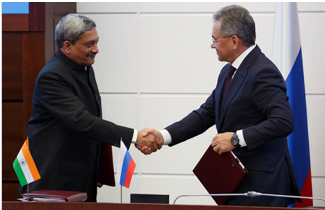
Министр обороны Индии Е.П. г-н Манохар Паррикар и министр обороны России Сергей Шойгу

Министр обороны Е.П. г-н Манохар Паррикар принял участие в 15-м заседании индийско-российской межправительственной комиссии по военно-техническому сотрудничеству.