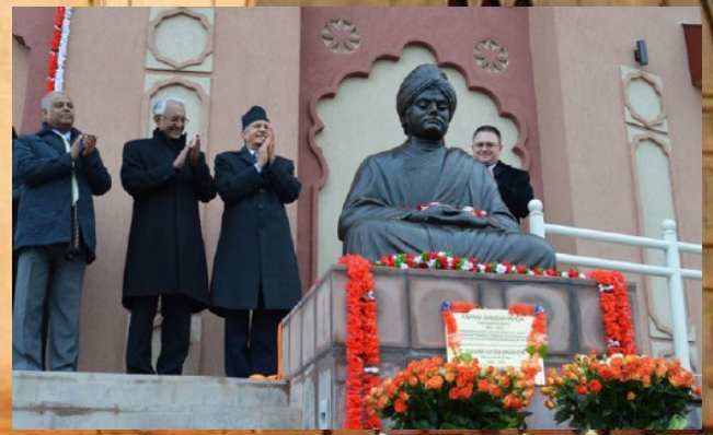
Открытие индийского Культурного центра в Этномире