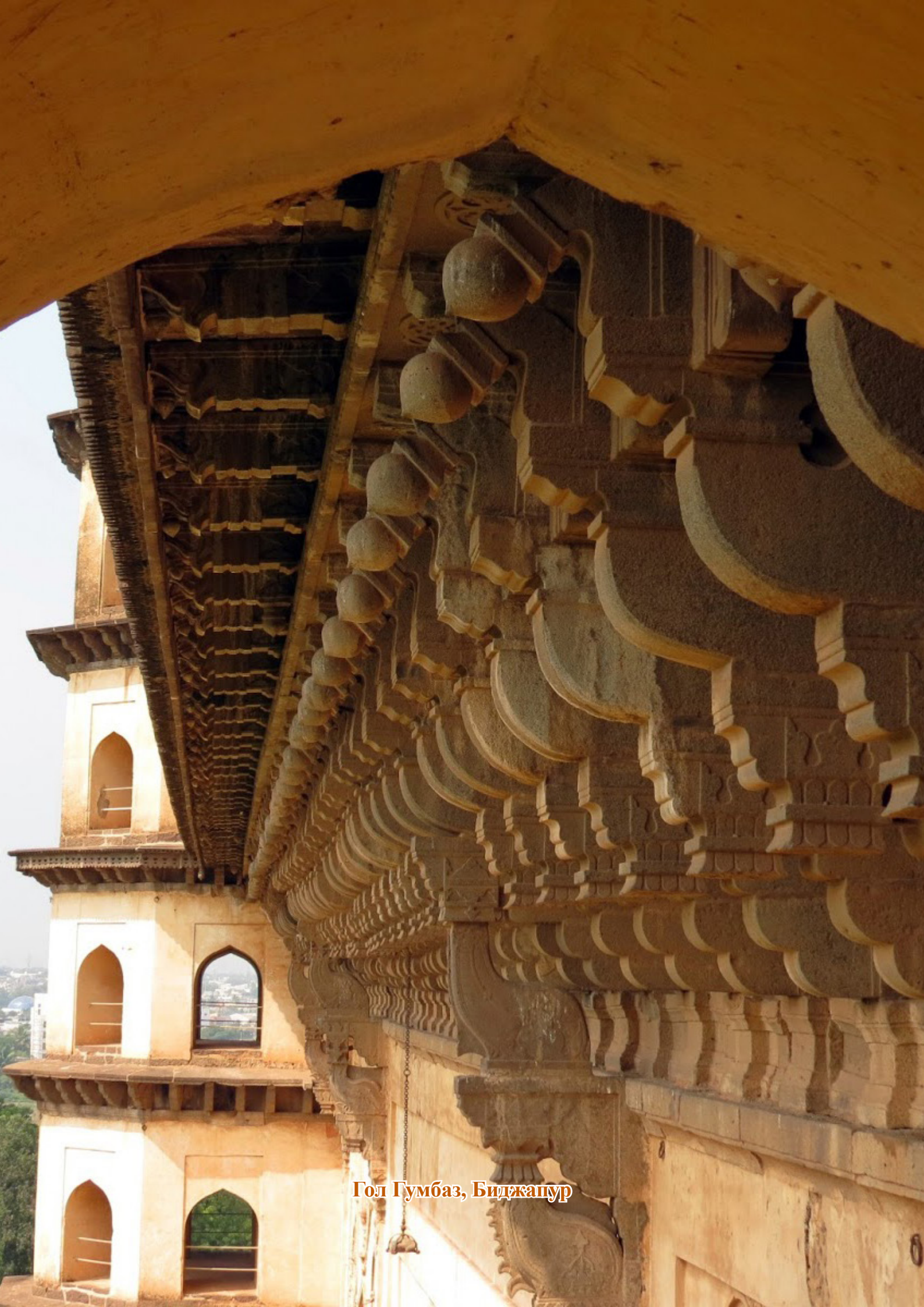
Гол Гумбаз, Биджапур