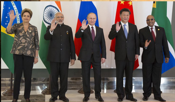
Визит премьер-министра в Турцию