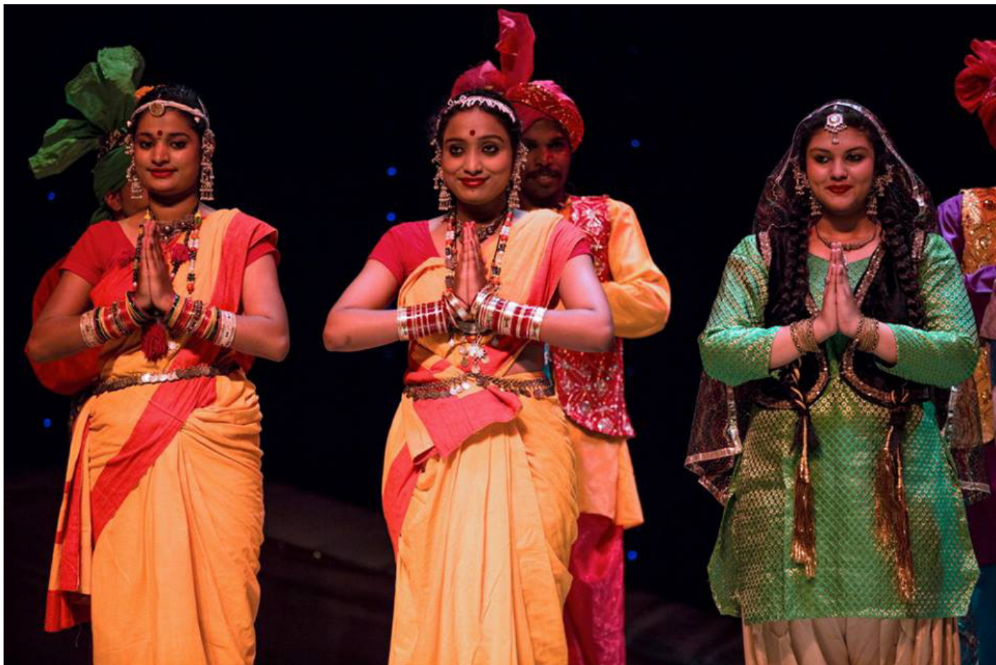
Народные и этнические танцы