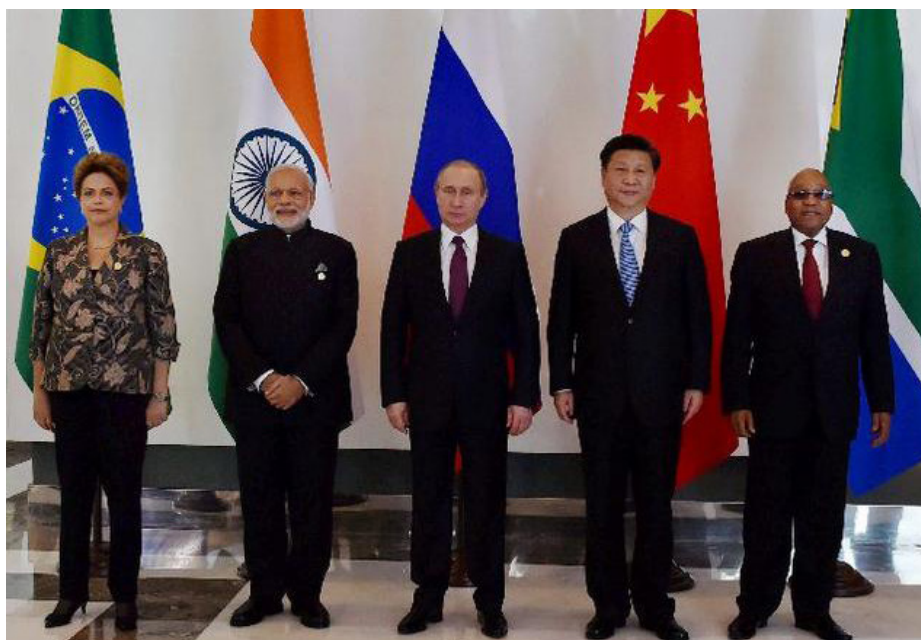
Лидеры стран БРИКС в Анталье

Контактная группа по торгово-экономическим вопросам и Деловой совет долж-