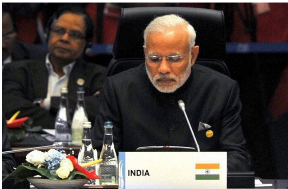
Заявление премьер-министра на встрече лидеров стран БРИКС

• внедрение решений по реструктуризации глобальных экономических институтов; • расширение сотрудничества между многосторонними и региональными финансовыми учреждениями; • укрепление долгосрочного финансирования инфраструктурных проектов в развивающихся странах;