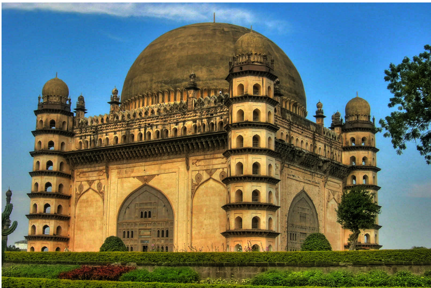
Гол Гумбаз, Биджапур