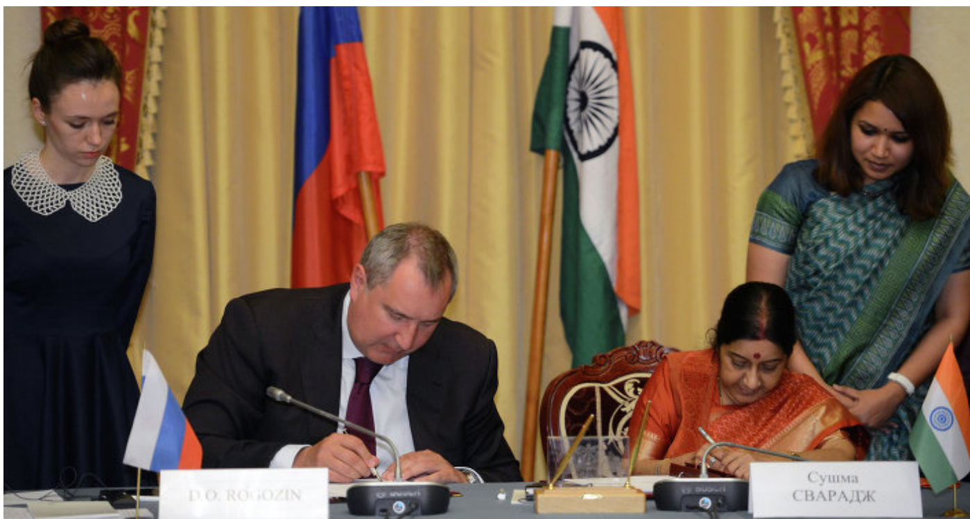
Е.П. г-жа Сушма Сварадж и Е.П. г-н Дмитрий Рогозин

Министр иностранных дел Индии Е.П. г-жа Сушма Сварадж находилась с официальным визитом в России с 19 по 21 октября 2015 г. для участия в очередном заседании индийско-российской межправительственной комиссии по торгово-экономическому, научно-техническому и культурному сотрудничеству в Москве.