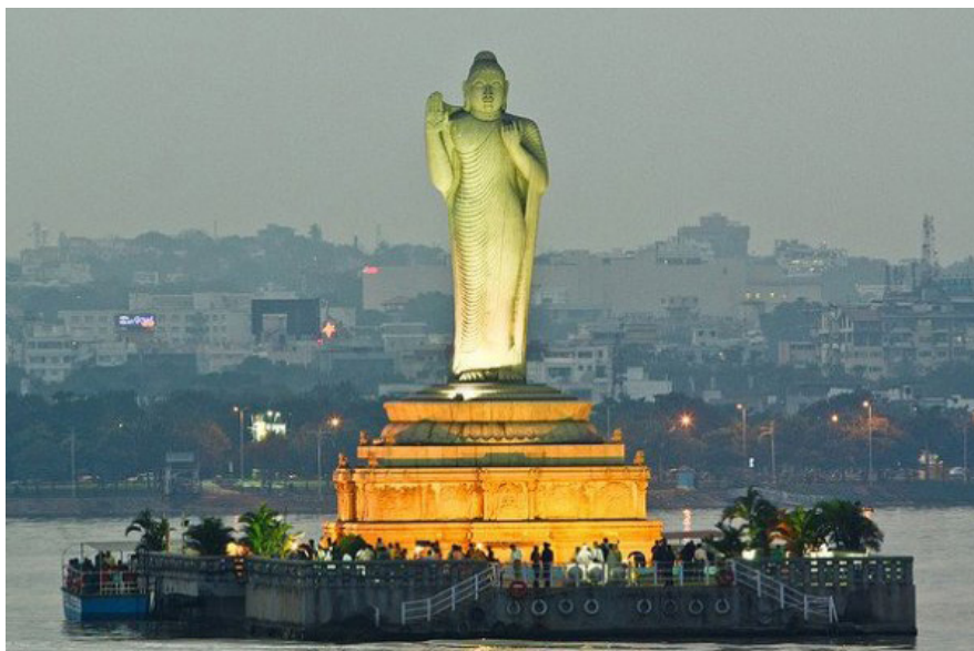
Самая большая в мире монолитная статуя Будды

В 1992 году тогдашний главный министр штата Андхра-Прадеш Н.Т. Рам Рао сделал это реальностью. Монолитная фигура Будды высотой 18 м и весом 450 тонн, над созданием которой трудились около двухсот скульпторов в течение двух лет, стоит на небольшом острове в центре озера Хуссейн Сагар и является главной его достопримечательностью для туристов и