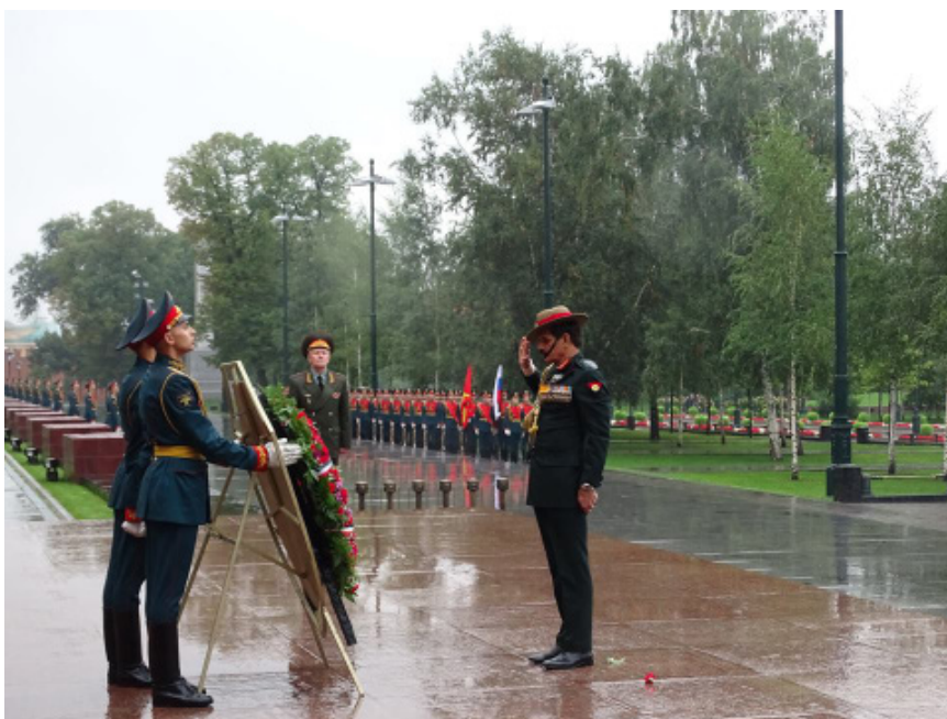
Делегация ОШ ВС и СВ Индии

Начальник штаба Сухопутный войск Индии Далбир Сингх, удостоенный медалей Парам Вишишт Сева, Юдх Сева, Ати Вишишт Сева, Вишеш Сева, адъютант, вместе со своей супругой и двумя офицерами посетил Москву с визитом доброй воли в период с 25 по 28 сентября 2015 г. Начальник штаба Сухопутный войск Индии встретился с несколькими высокопоставленными чиновниками в Москве, с командующим войсками Западного военного округа Российской Федерации в Санкт Петербурге, а также посетил Российскую Артиллерийскую Академию.