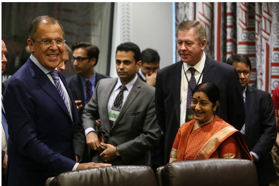
Е.П. г-жа Сушма Сварадж и Е.П. г-н Сергей В. Лавров