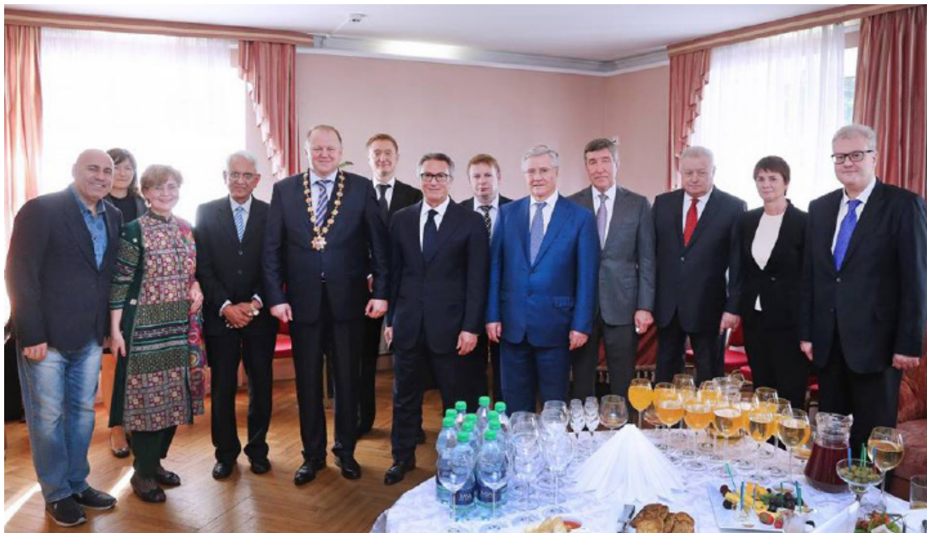
На церемонии инаугурации губернатора Калининградской области Е.П. г-на Н. Цуканова

По приглашению Губернатора Калининградской области Е.П. г-н Рагхаван, посол Индии в Российской Федерации, нанес официальный визит в Калининградскую область 21- 22 сентября 2015 г.