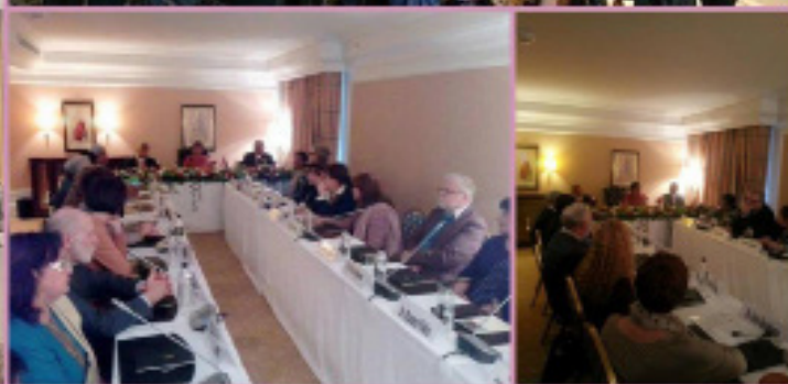
Министр иностранных дел г-жа Сушма Сварадж на встрече с российскими индологами