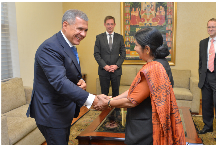
Е.П. г-н Рустам Минниханов и Е.П. г-жа Сушма Сварадж, Министр иностранных дел Индии

Он принял участие в индийско-татарстанском бизнес-форуме, организованном Конфедерацией индийской промышленности. Кроме Дели, Минниханов также посетил Мумбаи, где он провел встречи с представителями индийских компаний.