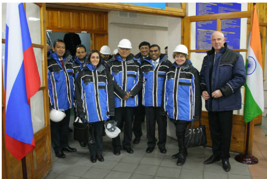
Посещение Волжского абразивного завода (ВАЗ)