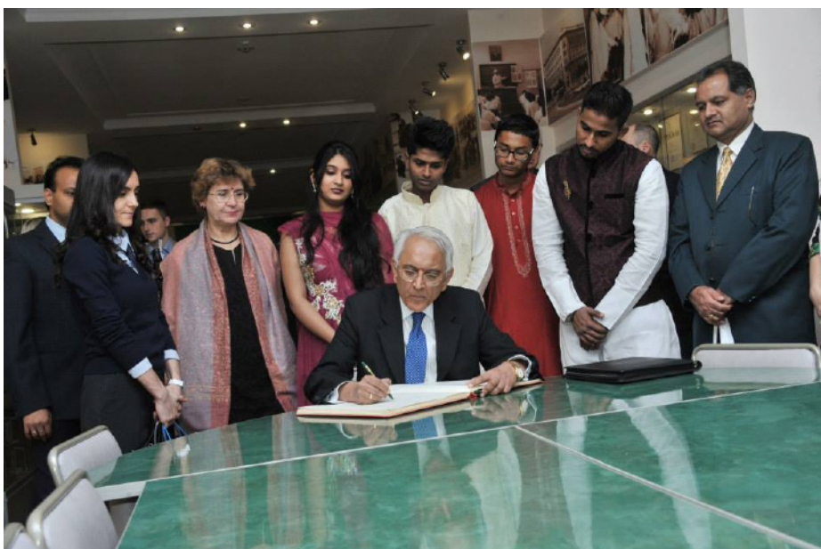
Посещение музея Волгоградского государственного медицинского университета