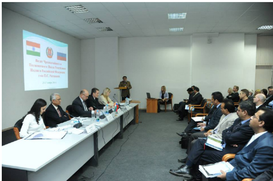
Встреча с волгоградским бизнес-сообществом в Министерстве Экономического развития Волгоградской области

Также Посол встретился почти с 375 индийскими студентами из Волгоградского государственного Медицинского университе-