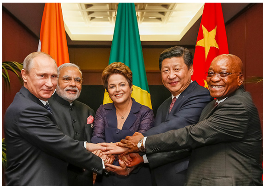
Премьер Министр Нарендра Моди, Президент России Владимир Путин, Президент Бразилии Дилма Роуссефф, Председатель Китайской Народной Республики Си Цзиньпин и Президент ЮАР Джейкоб Зума на полях Саммита G 20 в Брисбене, Австралия

Они подчеркнули, что подписание соглашений о создании Нового банка развития и Пула условных валютных резервов вывело сотрудничество в рамках БРИКС на принципиально новый уровень, поскольку созданы инструменты, способствующие стабильности международной финансовой