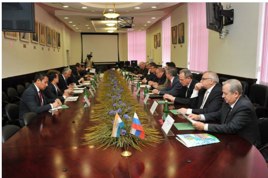
Встреча с Советом ректоров вузов