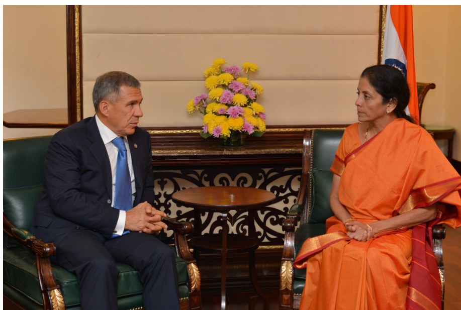
Президент Татарстана и Индийский министр торговли и промышленности обсуждают вопросы дальнейшего сотрудничества