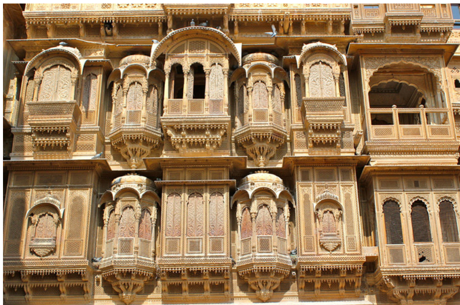
Патвон ки Хавели

Национальный парк пустыни - один из крупнейших парков в Индии. Пустыня – не самое благоприятное место для проживания птиц и животных, поэтому богатая флора и фауна располагается в основном по краям пустыни. Тем не менее, большинство птиц сюда прилетают. А поехав на джип-сафари