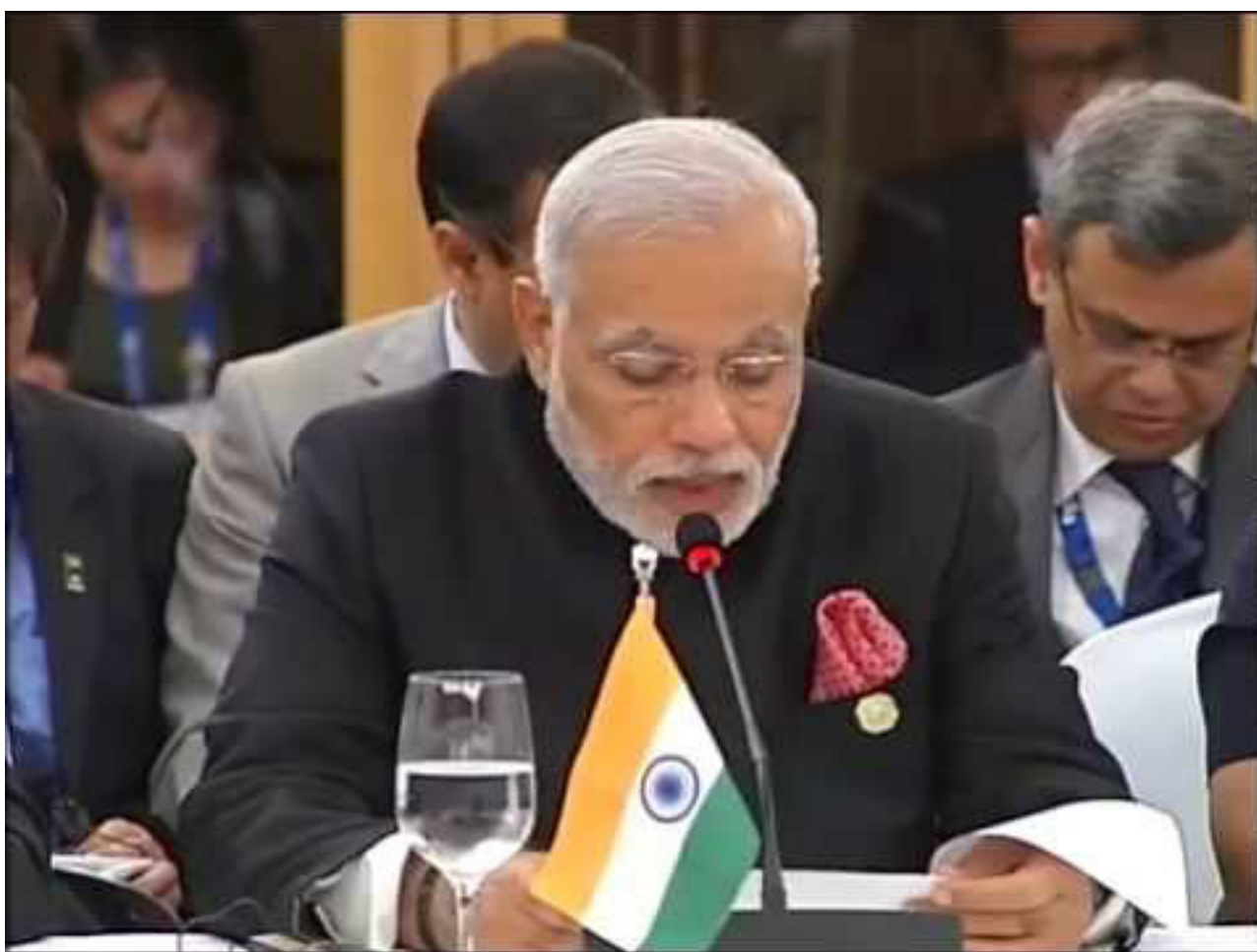
Премьер-министр Моди на встрече лидеров БРИКС на полях Саммита G20

Вступительная речь Премьер-министра на встрече лидеров БРИКС в Брисбене, Австралия 15 ноября 2014г.