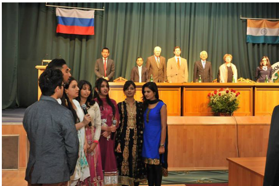
Индийские студенты Волгоградского государственного медицинского университета исполняют национальный гимн Индии