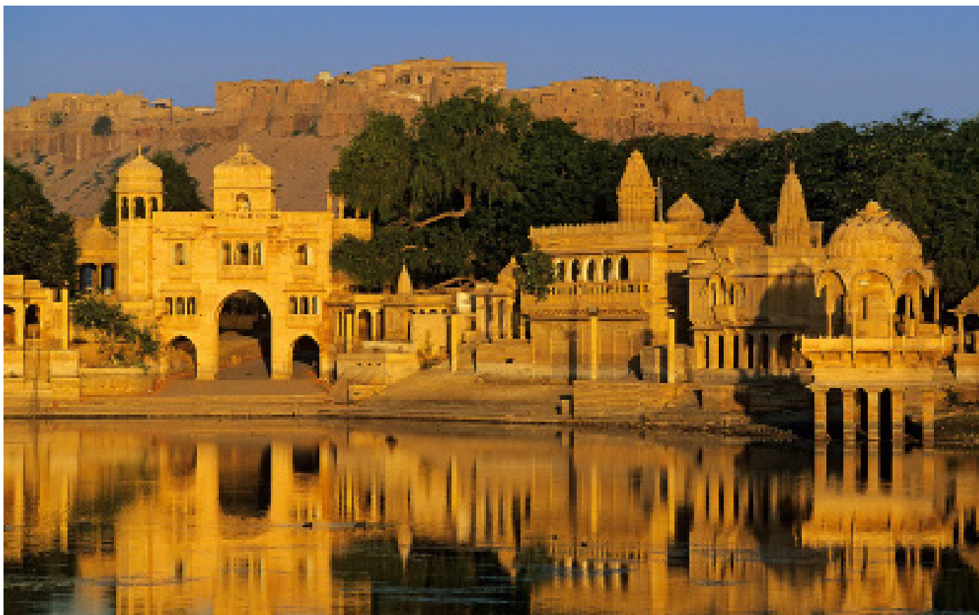
Озеро Гадисар, Джайсалмер

У правителей Джайсалмера сложились дружеские отношения с Моголами и теперь в Джайсалмер могольский стиль прекрасно сочетается с богатой архитектурой Раджастана.